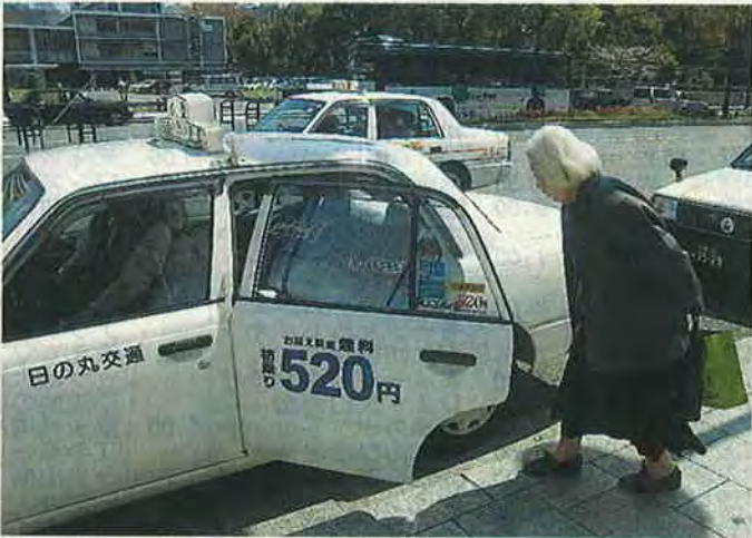
低料金をアピールするタクシー＝広島市中区